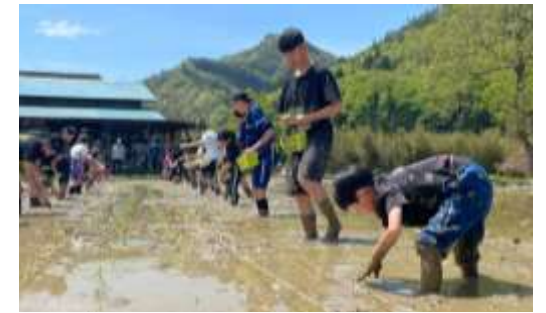
晴天の中、久しぶりの田植え★