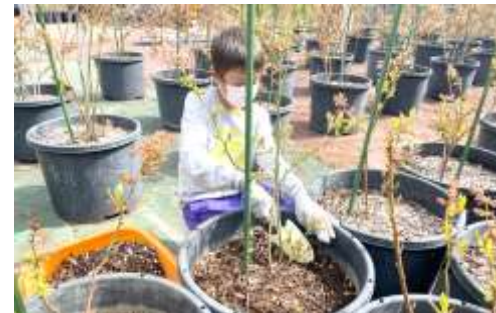
心を込めてブルーベリーを植えます！

先週木曜から HICS 課外授業が聖山高原チャペルにて行われています。今回はブルーベリープランティング、田植えの他、地域のボランティア活動にも参加しました。心も身体も信仰も大きく成長するキャンプになっています！