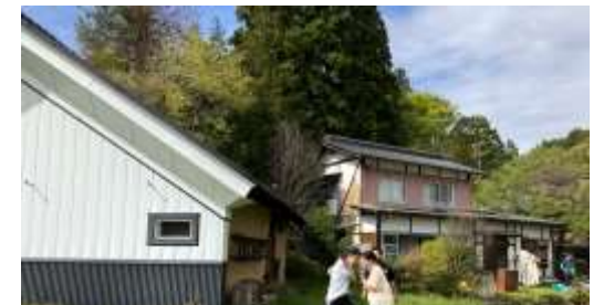
ボランティアで地域の古民家を大掃除