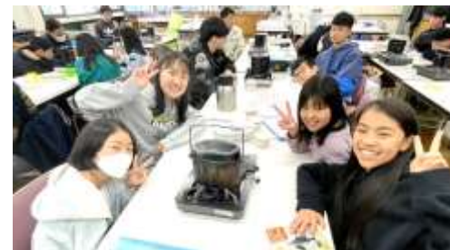
飯盒炊飯もしました♪