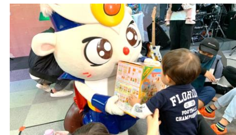
お友だち大喜びの大抽選会★