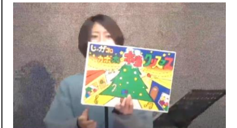
紙芝居で本当のクリスマスをメッセージ