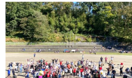
愛いっぱい恵みいっぱいの一日に感謝！