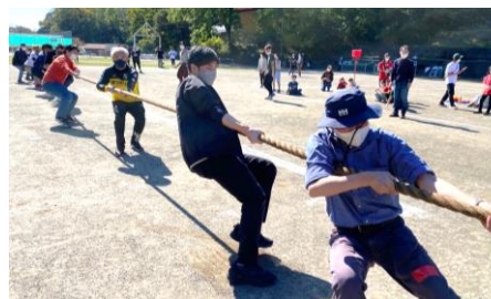
パパとママも全力で楽しめます★