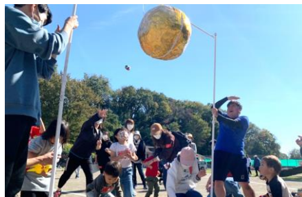
ジョイキッズ保育園のお友だちも頑張ります！

こどもの国にて、ジーザス・ファミリー・チャーチ、ジョイキッズ保育園、HICS、放課後デイサービス Annie の合同ピクニック&運動会を開催しました！総勢159名の方が参加して下さい、青空の下、のびのびと身体を動かしてリフレッシュしました♪