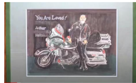
イラストとメッセージカードを贈呈しました