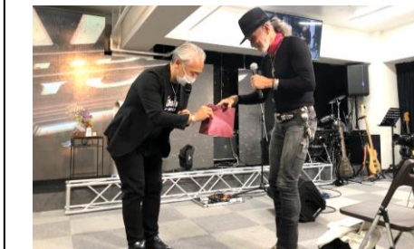
アーサー先生ありがとうございます！