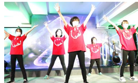
神様にパパ達に感謝を込めて 一生懸命ダンス！

先週の日曜日は父の日でした。日ごろお世話になっているお父さんに感謝を表す特別な時を持ちました！またワークショップのプログラムの中でもお父さん方が沢山活躍して下さい、とても楽しく素敵な日曜日になりました！