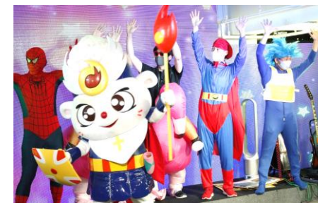
スキットにパパ達がヒーローになって 初出演★