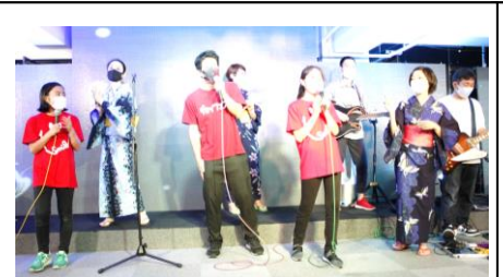
『おやじバンド』にサプライズでママ達も登場♪