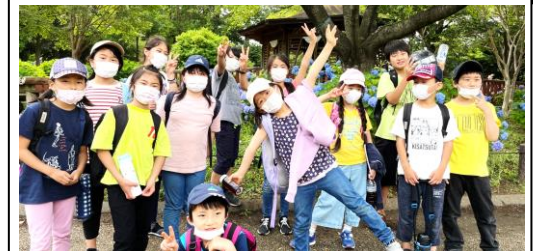
自然や生き物に触れてのびのび生き生きと 学習しました★