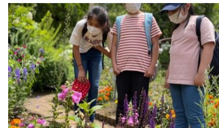
公園にあるお花を観察します