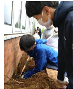
男子生徒で手強い根っこを掘り起こします

◆『ホープクリエイティブインターナショナルスクール』(HICS) の様々な活動 HICS では机上の学びの他に様々な体験型学習があります。今年度からはプロの方から学ぶ『総合クラス』が始まりました。先週はプロの剪定士から学んだ技術を活かしてビジョンセンターの花壇を整えました！