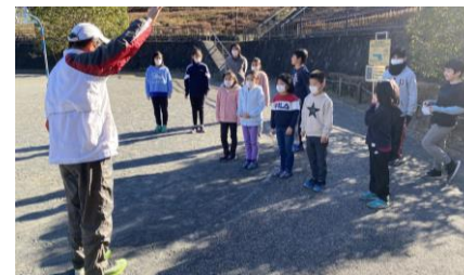
マラソンのプロに走り方も指導して頂きました