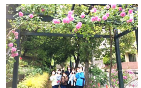
女子生徒は美しいお庭作りを見て学びます