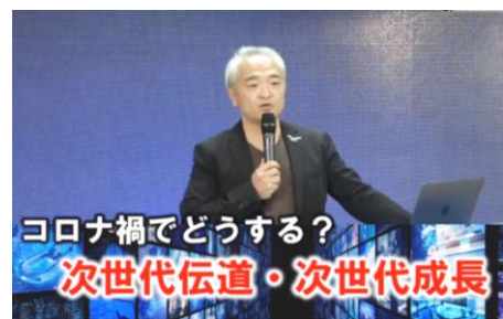
御言葉からイエス様の心を学びます

ジョイフェス実行委員会主催で、『コロナ禍どうする？』次世代伝道・次世代成長をテーマにしたセミナーが開催されました。100名を超える方々がオンライン参加して下さい、次世代伝道に心燃やされる時間となりました。次回セミナーは5月29日開催予定！