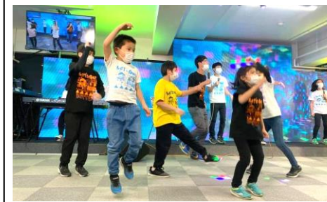
次世代による次世代のためのプログラム！