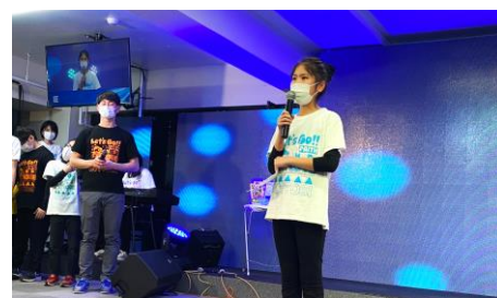
証しを通して次世代伝道の素晴らしさに感動します