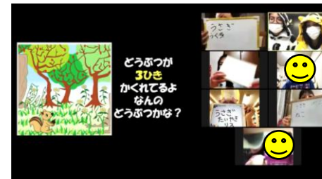
一位を目指して頑張ります！