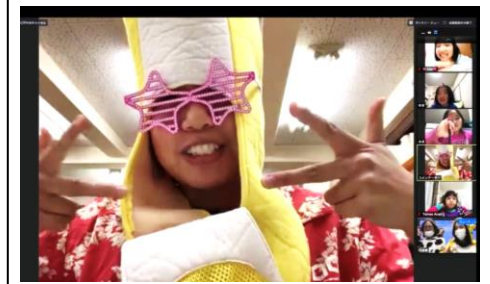
楽しいキャラクターと一緒にクイズに挑戦！