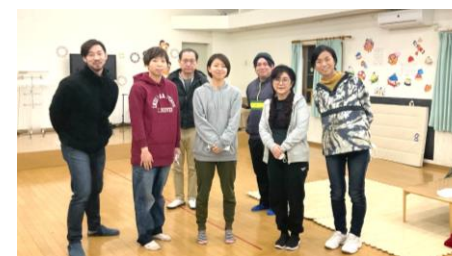
Annie スタッフの応援を宜しくお祈りします！