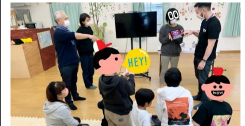
クリスマス会の様子