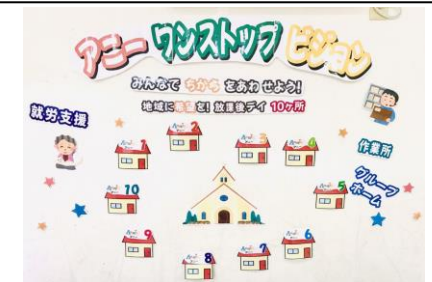
アニーワンストップビジョンを握って今年も走ります！