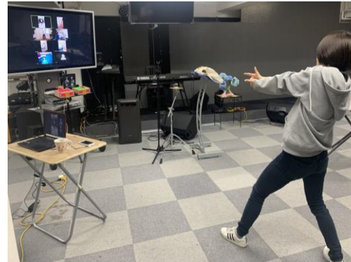
画面越しのレッスン生に全力で教えます

先月よりオンラインでのダンスレッスンが始まりました！レッスンを受けながら、なかなか会えない先生やお友だちとお話できる楽しい時間になっています♪