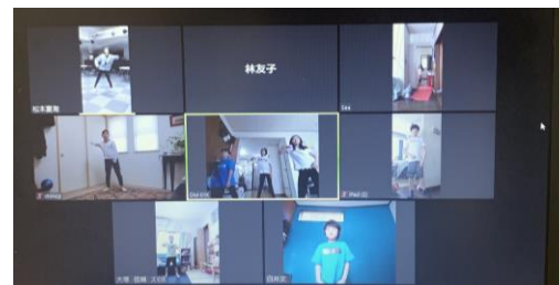
基礎練習も手を抜きません