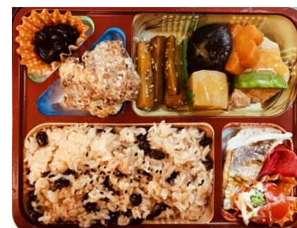
彩り鮮やか、栄養満点のお弁当